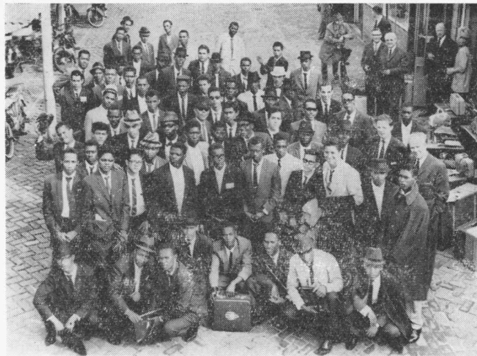
Deze rijksgenoten arriveerden 9 juni in ons land om bij Van der Heem, de ENAF en Indola de grondslag te leggen voor een goede toekomst in hun vaderland.

Wij hebben nu in onze bedrijven 170 Antillianen werken en dat legt ons de prettige plicht op ieder voor zich en allen samen ervoor te zorgen dat zij zich in hun werk en daarbuiten in Nederland nuttig kunnen maken en zich leren aanpassen. Zij hebben dezelfde rechten, maar ook dezelfde plichten als u en ik, maar kunnen die onmogelijk op het moment van intreden in het bedrijf allemaal precies weten. Dat wij deze, naar mijn mening mooie taak op ons nemen is niet alleen belangrijk voor ons als Nederlanders,